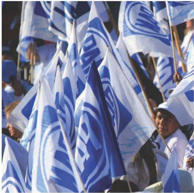
Deberán esperar el visto bueno del IEEM.