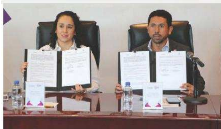
Acuerdan difundir la cultura democrática. ESPECIAL