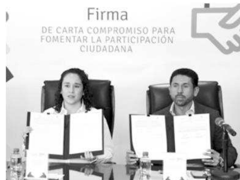
Concaem y el IEEM firmaron la “Carta compromiso para la participación ciudadana”.

El líder empresarial anunció que habrá apertura hacia todos los que