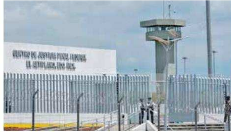
Se llevará a cabo el voto en el Centro Federal de Readaptación Social número 1 de Almoloya de Juárez.

Es así que dio a conocer que serán 118 personas privadas de la libertad quienes voten y habrá dos personas del INE únicamente. “Una parte del protocolo refiere que quien haya trabajado en los centros penitenciarios como administrativo o custodio no podrá ser representante de partido ni observador, quien haya cumplido alguna sentencia, tampoco y la vestimenta del personal del órgano electoral no debe